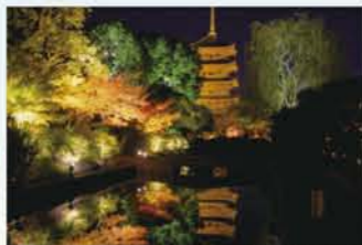
秋の夜間特別拝観