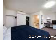
ユニバーサルルーム