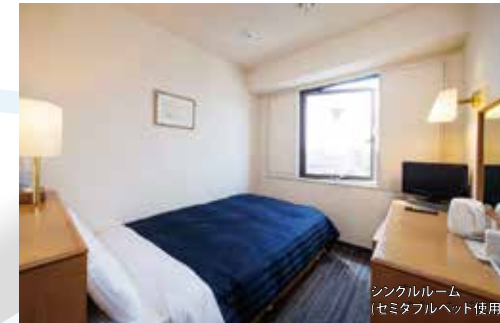
シングルルーム (セミダブルベッド使用)