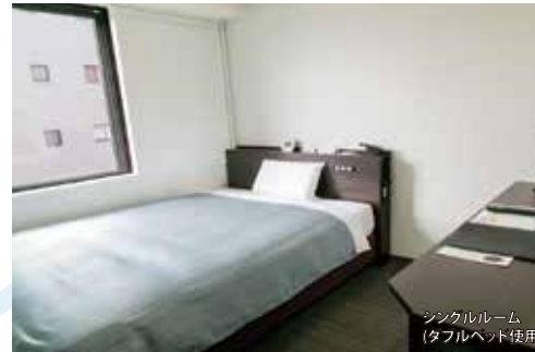
シングルルーム (ダブルベッド使用)