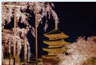
春の夜間特別拝観