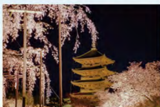
春の夜間特別拝観