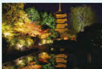
秋の夜間特別拝観